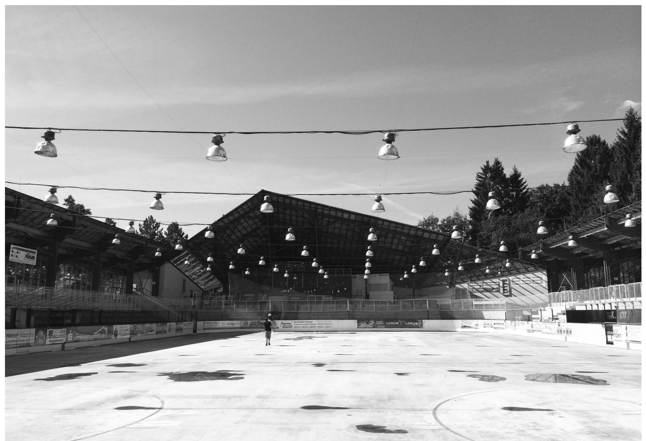
Zustand Stadion 2019

Die Eishalle wird über ein Schichtlüftungssystem klimatisiert. Die Klimatisierung der Halle dient nicht ausschließlich dem Nutzerkomfort, sondern verhindert durch die Entfeuchtung eine zu hohe Luftfeuchtigkeit. Zu hohe Luftfeuchte bringt Nebel- und Reifbildung, verursacht Bauschäden, führt zu schlechter Eisqualität und Sichtbehinderung, was den Spielbetrieb beeinträchtigt.